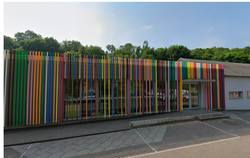
Bomel Crèche Dorémi (ASBL Selina PSE), entrepôt Qualias et locaux de stockage pour Ocarina (mouvement de jeunesse de la MC)