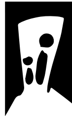
Association Notre Dame