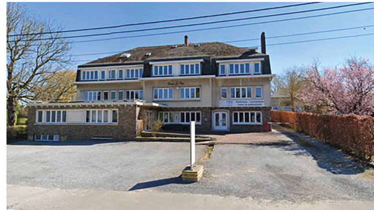
Ciney Avenue Schlögel dont l'usage est à définir dans les années à venir...