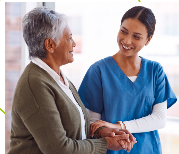
Projet transition domicile-maison de repos

Projet "Transition du domicile à la maison de repos"