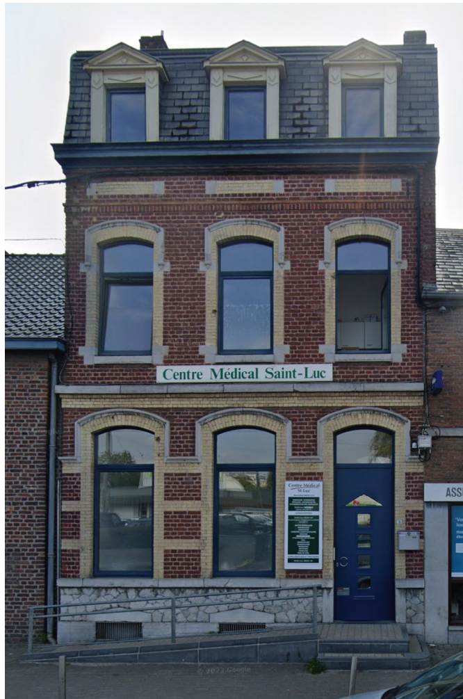
Andenne Centre médical de la Clinique St-Luc de Bouge